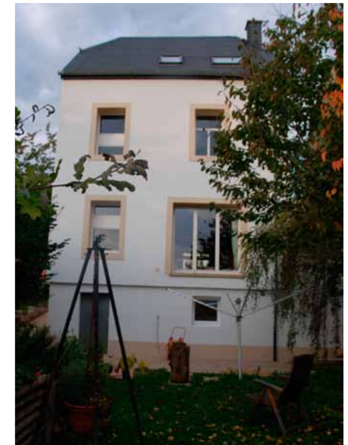
Après assainissement avec isolation extérieure