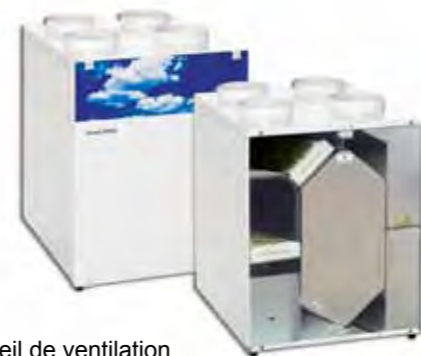
Appareil de ventilation contrôlée

Sous certaines conditions, les appareils de ventilation mécanique contrôlée sans récupération de chaleur peuvent profiter d'une subvention plus modérée.