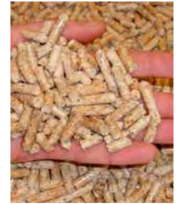
Granulés de bois