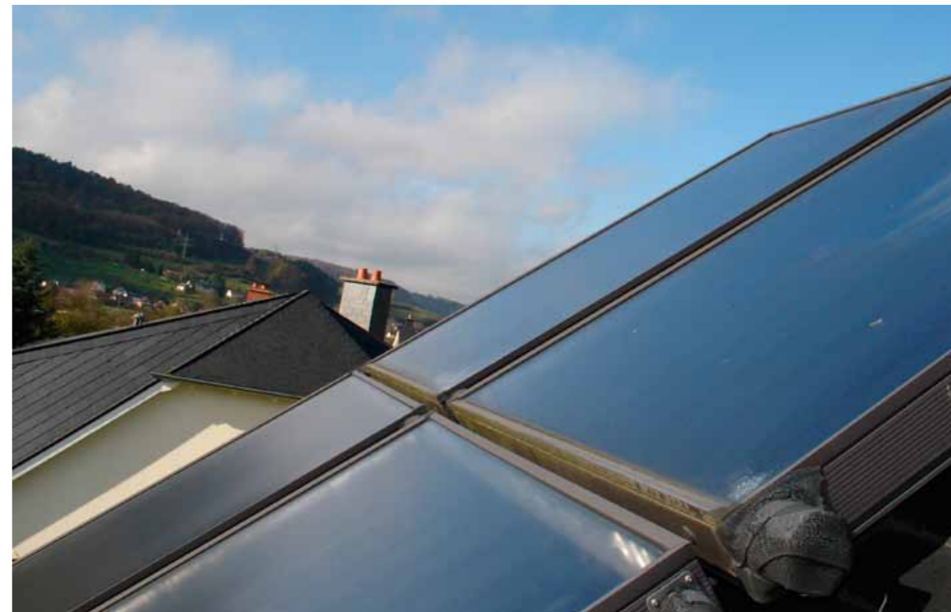
Installation solaire thermique – collecteur plan