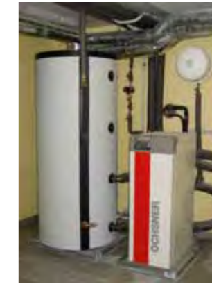
Pompe à chaleur

Les aides financières pour le recours aux énergies renouvelables dans le domaine du logement se rapportent aux coûts d'investissement de l'installation respective et sont limitées à un montant maximal. Ces subventions s'appliquent aussi bien aux projets de rénovation qu'aux nouvelles constructions et peuvent également être sollicitées indépendamment d'un tel projet.